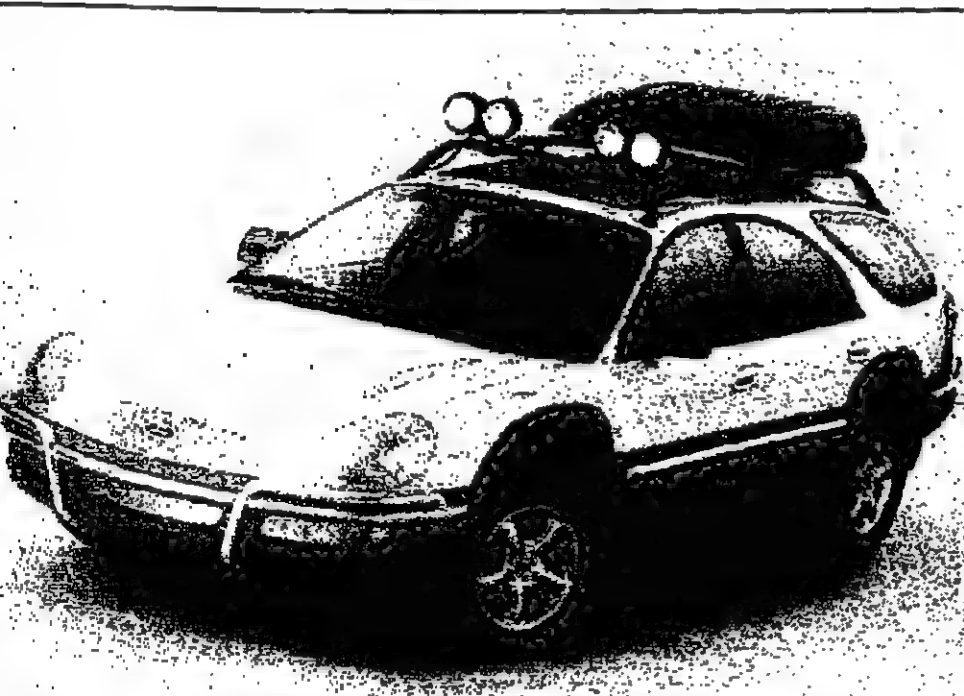
موتور جيبسي اسبقرة مساندا في من لانتاج فورد عرض اسس. والسيارة الجديدة ذات اربعة عجلات ممتعة وتبلغ سعها محركها 344 وتتميز بقدرتها على السير على الطرقات الوعرة.

وقال وزير الاقتصاد احمد بن عبد شمس: ان الميزانية للعام 1997 هي في حدود 2.266 مليار ريال.